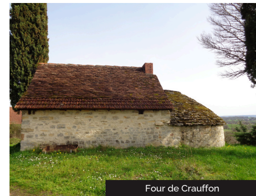
Four de Crauffon

10 Après 350m, prendre à gauche le chemin enherbé. Au carrefour de chemins, continuer tout droit et faire un aller/retour jusqu'à la source Saint-Martin. Au retour, prendre à droite pour rejoindre le parking.