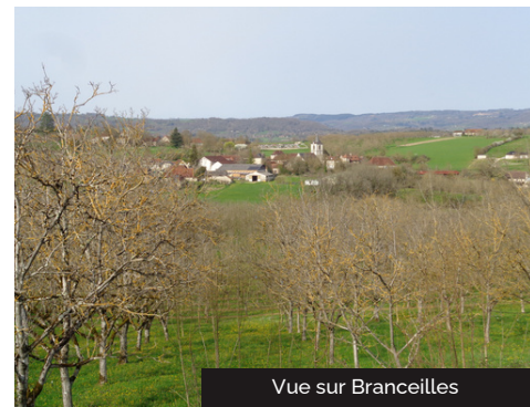
Vue sur Branceilles